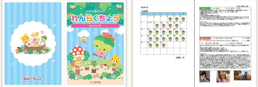
※デザインはイメージです。※デザインは予告なく変更になる可能性があります。

ご入金後15日以内に発送 ※GW・お盆・年末年始・2~3月はそれ以上かかる場合がございます。